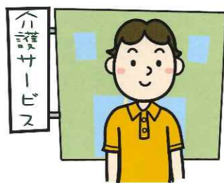
介護サービス事業者