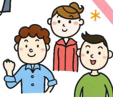
ボランティア団体